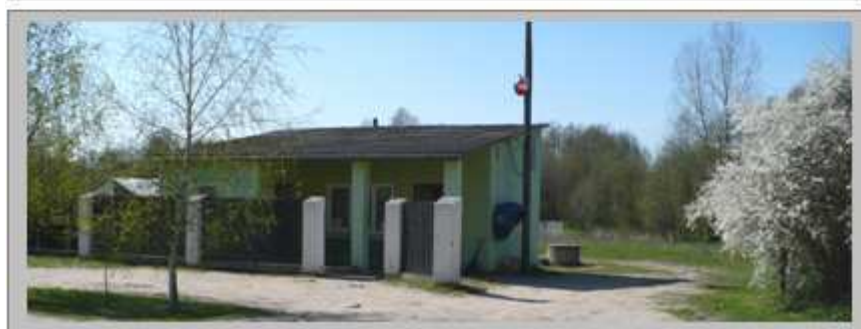
Przykłady działalności gospodarczej w Rudkach; - sklepy sportowe – przemysłowe oraz usługi ogólnobudowlane

Rudki jak i inne miejscowości gminy Przyłęk ze względu na swoje uwarunkowania, jest miejscowością typowo rolniczą, która co prawda w latach 90-tych z uwagi na procesy dostosowawcze do tworzących się wówczas rynkowych warunków gospodarowania ograniczających zatrudnienie w sektorze państwowym, przeżywała wzrost zainteresowania rozwojem sektora prywatnego, nie mniej jednak na terenie wsi nie pojawił się dotychczas żaden bardziej znaczący podmiot gospodarczy. Mieszkańcy wsi poza zatrudnieniem we własnych gospodarstwach rolnych znajdują zatrudnienie głównie w pobliskich miastach, zwłaszcza w Zwoleniu.