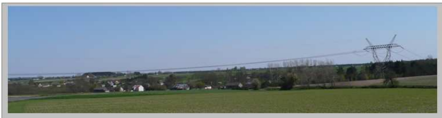
Rudki, widok od strony Mszadli

Położenie gminy w obrębie Równiny Radomskiej w dolinie rzeki Zwoleńki, Plewki i Wisły, brak przemysłu i zanieczyszczeń, duże powierzchnie lasów, sprawiają, że głównym walorem gminy są czysta woda, powietrze i malownicze krajobrazy.