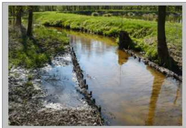
Atrakcyjna okolica sprzyja turystom – brak oznaczonych szlaków turystycznych