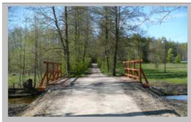
Nowo zmodernizowany most na rzece Plewka