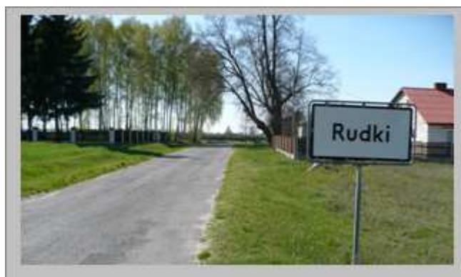
Wjazd do miejscowości od strony Baryczki

W 1934 roku nastąpiła komasacja gruntów, w wyniku której wieś została podzielona na Rudki Nowe i Rudki Stare. Część gruntów wiejskich przeznaczono na potrzeby oświaty