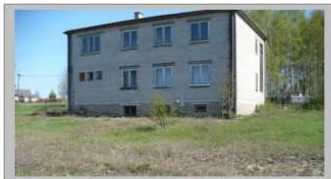
Teren za budynkiem – z możliwością usytuowania mini boisk i placu zabaw dla dzieci