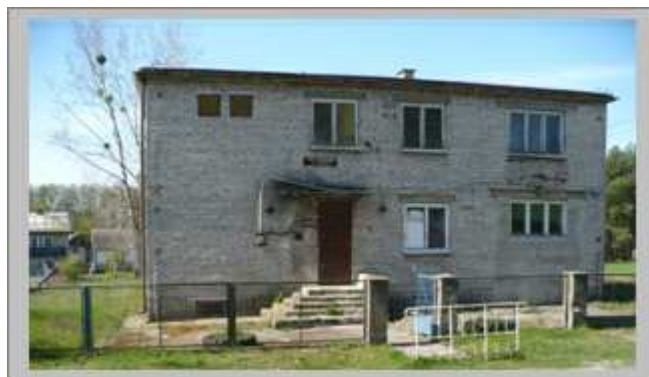
Obecny stan budynku po szkole podstawowej