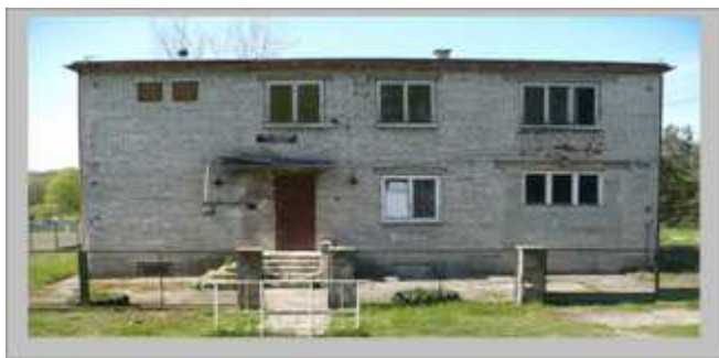
Budynek po szkole podstawowej w Rudkach