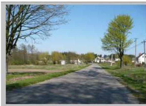
Droga powiatowa relacji Zwolen - Baryczka

Ochotniczej Straży Pożarnej wyposażonej w samochód strażacki i niezbędny sprzęt. W latach siedemdziesiątych wybudowano drogę łączącą gminę Przytyk z